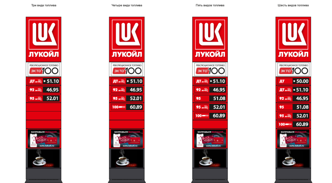
Информационная ценовая стена «Мини»