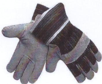
Рисунок - Вид перчаток рабочих

Перчатки рабочие изготавливаются из х/б ткани с кожаным спилком. Изготовление перчаток рабочих должно быть в соответствии с ГОСТ 12.4.183-91.