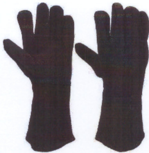
Рисунок – Вид рукавиц огнестойких