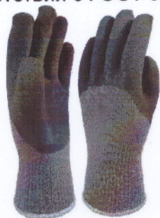
Рисунок – Вид перчаток комбинированных с защитным покрытием

Перчатки комбинированные с защитным покрытием (с латексным покрытием ладони). Изготовление перчаток комбинированных с защитным покрытием должно быть в соответствии с ГОСТ 5007, ГОСТ 12.4.183, ГОСТ 12.4.146.