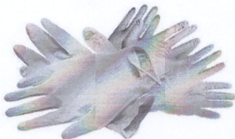
Рисунок - Вид перчаток медицинских, одноразовых одноразовые

Перчатки Медицинские одноразовые должны соответствовать ГОСТ Р 52239-2004 (ИСО 11193-1:2008)